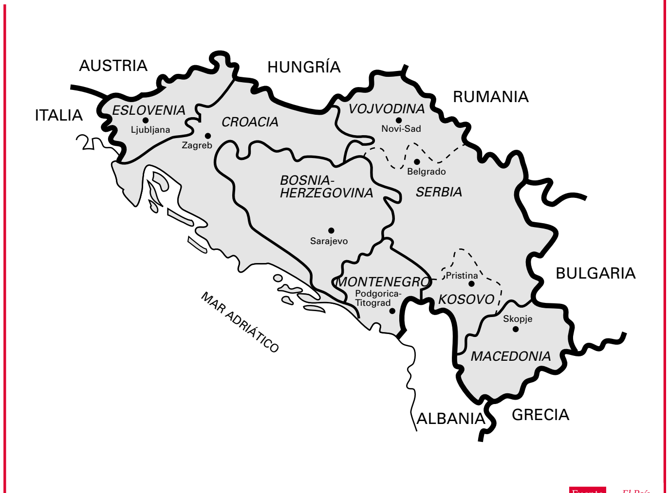
Mapa 1 El estado federal yugoslavo

Por último, los conflictos yugoslavos obligan a distinguir, como tantas veces, entre los pueblos y los gobiernos : no estamos ante un enfrentamiento entre comunidades humanas en el cual unas sean un dechado de perfecciones y otras alarmantes engendros del mal. No hay justificación alguna, en particular, para culpabilizar colectivamente