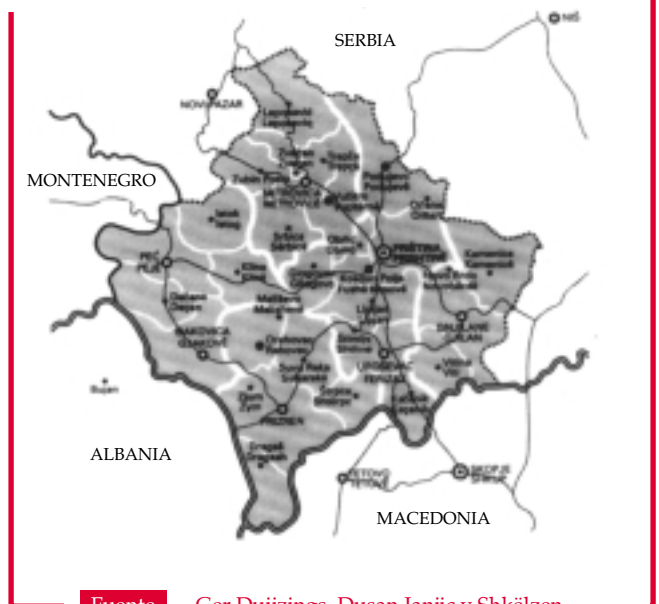
Mapa 2 Kosova

Mucho se ha discutido sobre los objetivos de los bombardeos de la OTAN. No puede darse crédito, por falta de antecedentes de comportamiento al respecto, a la idea, tantas veces difundida por la propaganda al uso, de que el propósito de aquéllos estribaba en restaurar el vigor de los derechos humanos conculcados en Kosova. Los objetivos de la Alianza eran mucho más prosaicos y se insertaban de manera más sencilla en su trama natural: restaurar una imagen que se había ido deteriorando —tras un sinnúmero de amenazas no llevadas a la práctica— con el paso de los meses, prevenir la eventualidad de una extensión de la crisis kosovar a la vecina Macedonia —y con ella el riesgo de una internacionalización del conflicto que hubiese podido conducir a una confrontación entre Grecia y Turquía, dos estados miembros de la OTAN—, dejar bien sentado cuál es la única gran potencia